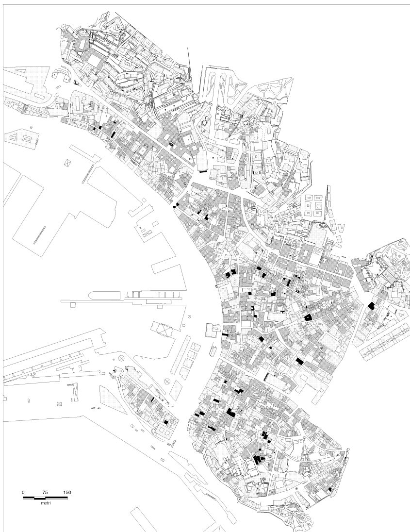
Fig. 11 - Planimetria della città vecchia di Genova. In nero gli edifici che hanno mantenuto integralmente i caratteri costruttivi medievali, in grigio scuro quelli che conservano un'immagine risalente al XVI-XVII secolo.