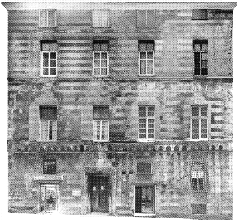
Fig. 2 - Palazzo di Marcantonio Sauli (via San Bernardo, 19). Mosaico ortofotografico della facciata.

Palazzo Sauli (Fig. 2), costruito attorno al 1580 in Platea Longa (oggi via San Bernardo), e quindi nella parte di città più antica, è un esempio di come i condizionamenti della topografia del luogo siano superati dalla capacità tecnica e dall'abilità nel costruire dei magistri antelami che realizzano un organismo di grandi dimensioni, rispettoso delle preesistenze costituite dalla domus magna della famiglia Zaccaria 11 , ma privo di uniformità nell'insieme. Diverso dalle soluzioni "organiche" di Strada Nuova ad esso contemporanea esso è dotato di una disposizione funzionale degli spazi non più medievale.