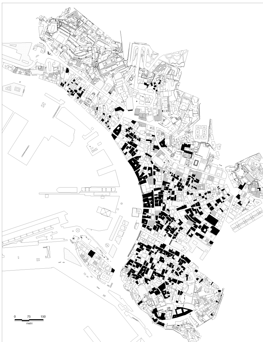
Fig. 12 - Planimetria della città vecchia di Genova. In nero gli edifici che conservano “reperti” archeologici di origine medievale, in grigio scuro quelli che racchiudono elementi risalenti al XVI-XVII secolo.