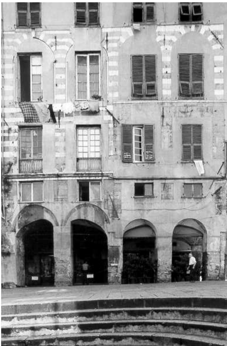
Fig. 7 - Palazzo Adorno (via al Ponte Reale, 1). Facciata. Sono visibili gli interventi ottocenteschi dell'architetto E. Mazzino che ha portato alla luce il paramento a strisce bianche e nere.