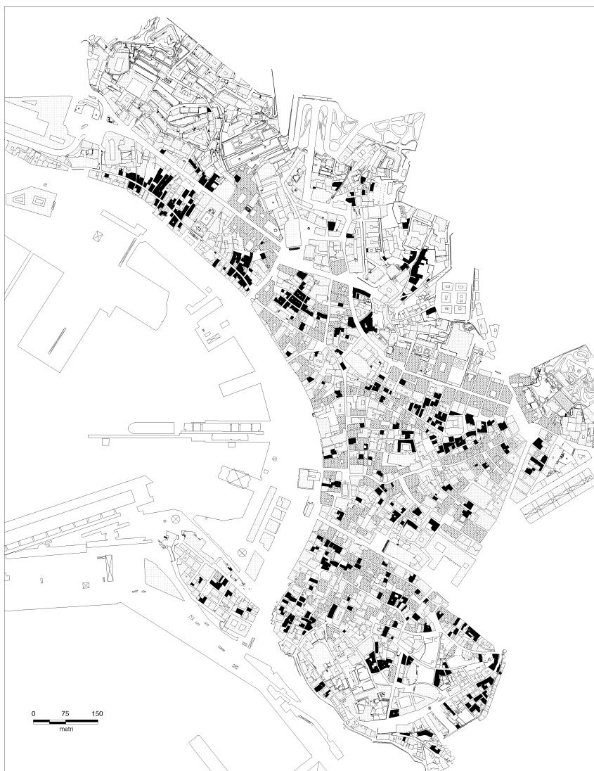
Fig. 10 - Planimetria della città vecchia di Genova. Tipi connotativi. Al colore nero corrispondono le case popolari d'età moderna, le case d'affitto di età moderna e le case popolari medievali, in grigio scuro i palazzi nobiliari di età moderna.