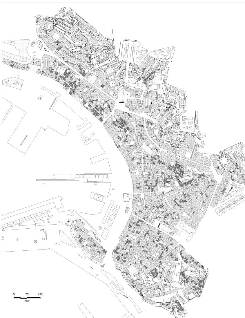
Fig. 9 - Planimetria della città vecchia di Genova. In grigio scuro il piccolo particellare, in grigio chiaro il grande particellare.