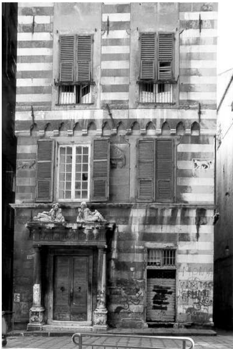
Fig. 4 - Palazzo Salvago (piazza S. Bernardo, 26). La prima sede dell'albergo (XV sec.). La facciata a strisce bianche e nere riportate alla luce nel restauro del 1937.