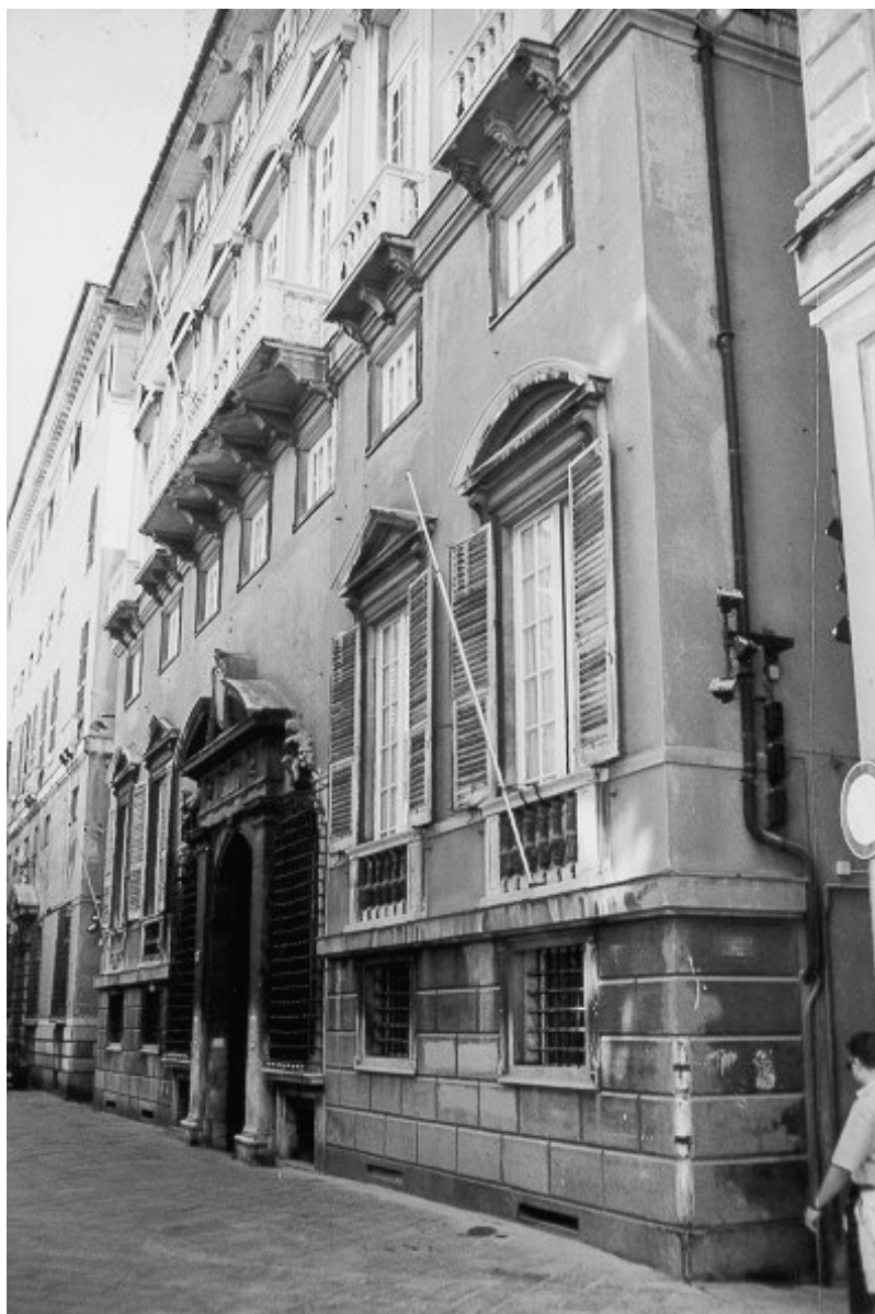
Fig. 5 - Palazzo Salvago (via Garibaldi, 12). Il palazzo di rappresentanza in Strada Nuova costruito nel 1562 per i Lomellini e acquistato dopo pochi anni dai Salvago. Scorcio della facciata.