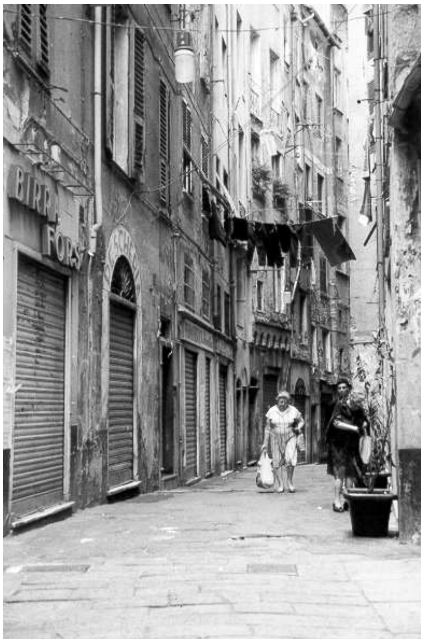
Fig. 6 - Scorcio di una schiera in via Ravecca.