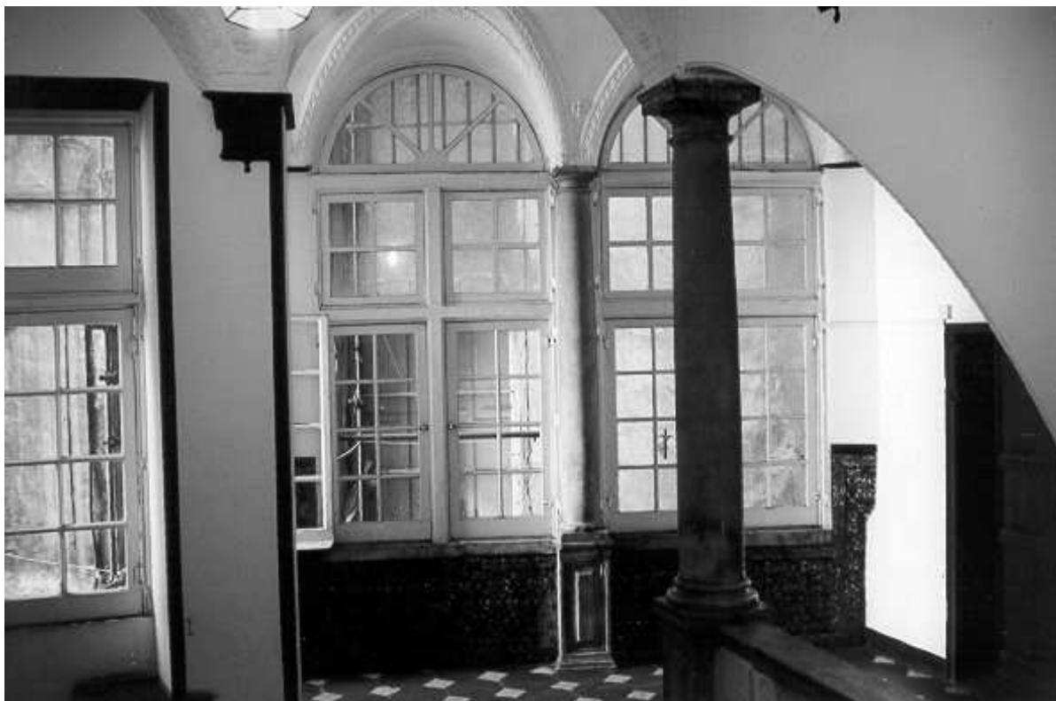
Fig. 3 - Palazzo Pinelli (piazza Pinelli, 2). Vano caposcala al piano nobile. Particolare del loggiato con le pareti parzialmente rivestite in azulejos .