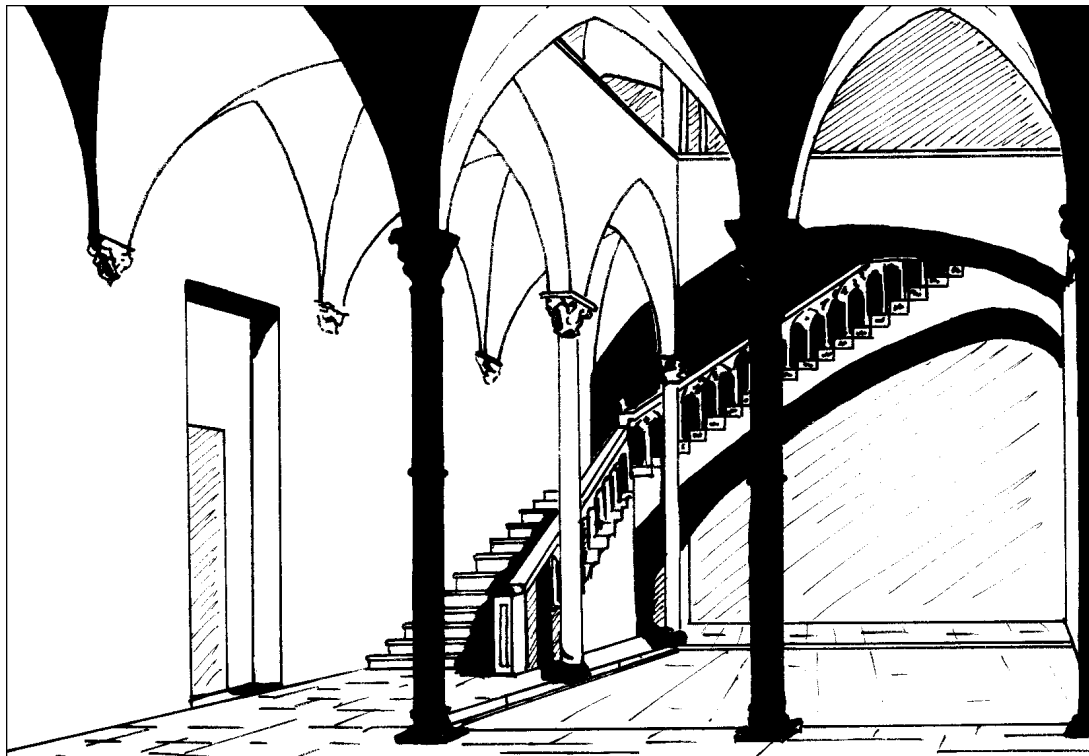
Fig. 1 - Palazzo di Brancalone Grillo (vico Mele, 6). Ricostruzione di come doveva apparire il cortile interno prima del tamponamento parziale del porticato (visibile in primo piano). Sullo sfondo lo scalone loggiato ad angolo.