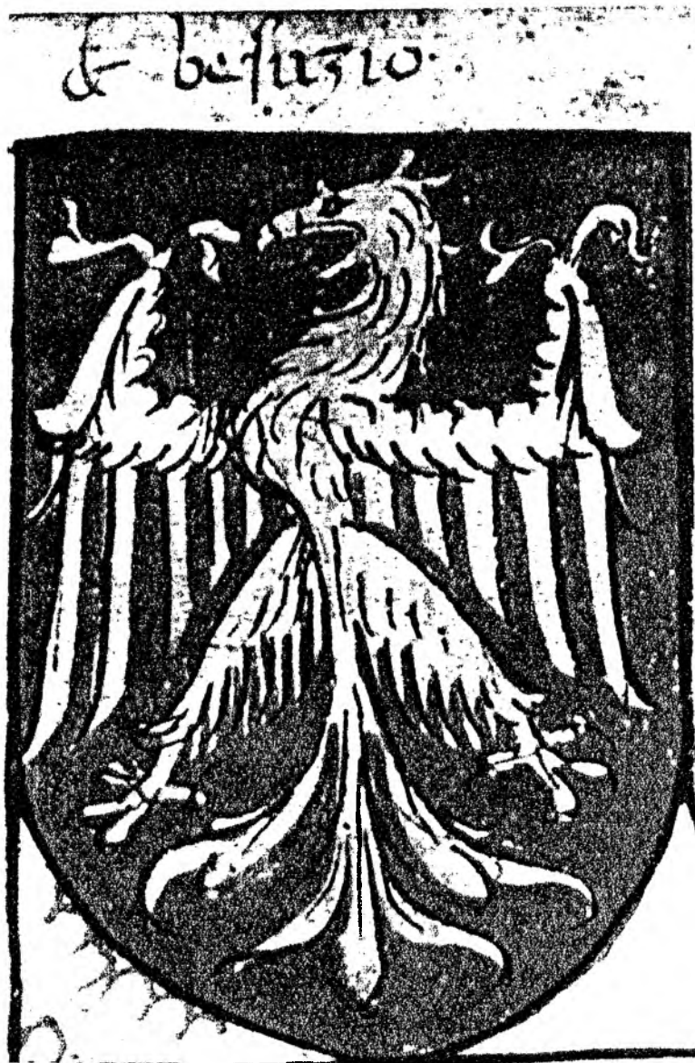
Fig. 3 - Milano, Biblioteca Trivulziana, Cod. Triv. 1391, compilato dal pittore Giovanni Antonio da Tradate tra il 1450 ed il 1466. Si tratta dell'armoriale più antico.